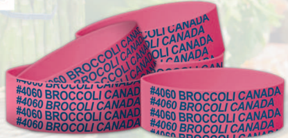
CPP: Conteo de Bandas por Peso

Nuestras Bandas estándar impresas de PLU le ofrecen la posibilidad de etiquetar el artículo con el nombre del país de origen y el número de PLU. Esto permite una fácil referencia al momento de pagar.