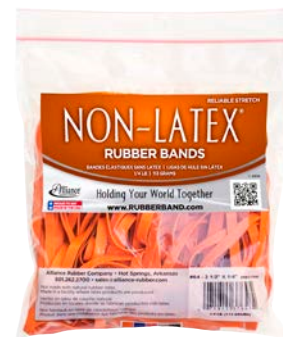
1/4 LB POLY BOLSA